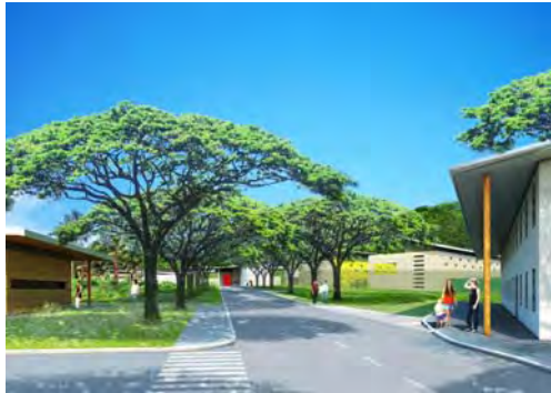
Croquis du futur centre pénitentiaire