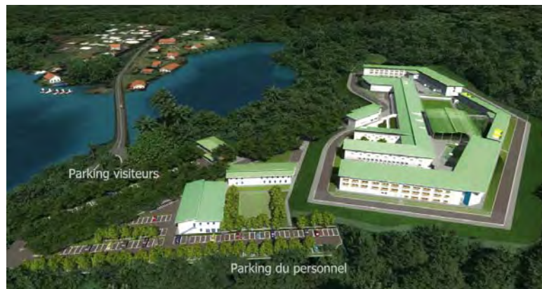
Vue aérienne du futur centre pénitentiaire

L'Agence publique pour l'immobilier de la Justice (APIJ) a été mandatée par le Ministère de la Justice pour mener à bien la construction du nouveau centre pénitentiaire en Polynésie française afin d'offrir des conditions de détention dignes pour les personnes détenues, de préparer leur réinsertion, d'améliorer les conditions de travail du personnel. L'entreprise Léon Grosse a remporté le marché. Le permis de construire a été accordé au mois de mai, ce qui a permis de débiter les travaux de défrichage dès le mois de juillet. Les travaux de terrassement sont en cours afin que les travaux de gros œuvres puissent commencer dans le début de l'année 2014, pour une livraison prévue mi 2016. Les travaux de construction du centre pénitentiaire représentent un investissement de 9,403 milliards de Francs CFP.