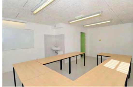
Salle de formation pour l'insertion sociale des détenus